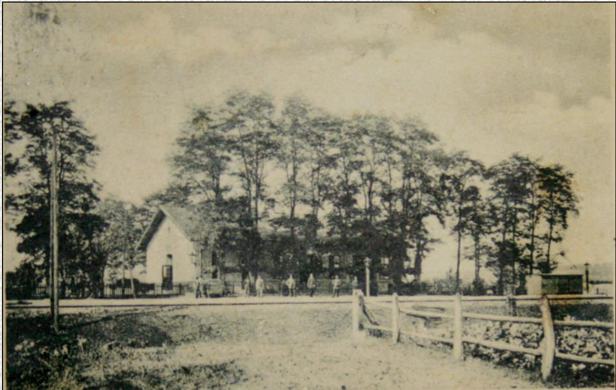
Stacja kolejowa Nizankowice, 1905.

Natomiast Sanok w 1884 r. dołączył do trasy Galicyjskiej Kolei Transwersalnej, łączącej miejscowość Czadca (ob. Słowacja) (poprzez Żywiec, Nowy Sącz, Jasło, Krosno, Zagórz, Chyrów, Sambor, Drohobycz, Stryj, Stanisławów) z Husiatynem (ob. Ukraina).