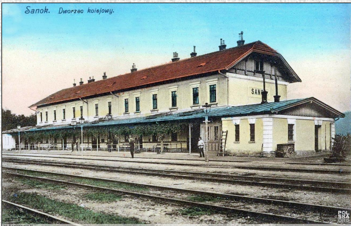
Dworzec kolejowy w Sanoku.